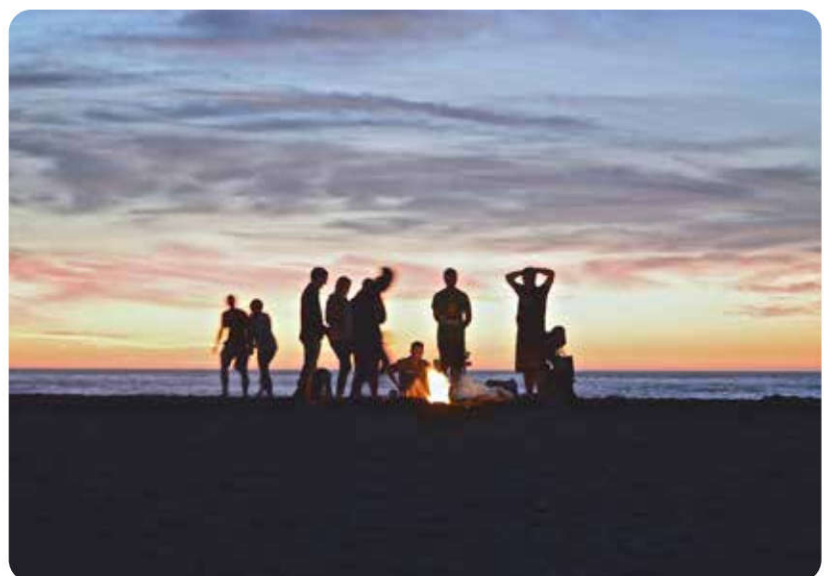
Soziale Beziehungen sind Teil unserer Identität

Und plötzlich ist die Frage „Wer bin ich“ für einen persönlich nicht mehr befriedigend zu beantworten. Man fühlt sich orientierungslos. Diese innere Orientierungslosigkeit ist für den Menschen nur schwer zu ertragen.