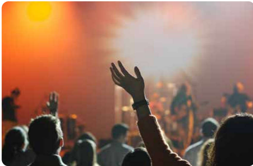
Unser Glaube soll nicht nur ein identitätsstiftender Punkt unter vielen sein

All das, was hier beschrieben ist, betrifft jeden Menschen, egal ob er Christ ist oder nicht. Was ist nun der Unterschied bei Christen? Bei Christen kommt zu den sieben Faktoren noch einer dazu: ihr Glaube. Das Wissen, dass wir geschaffen sind, gewollt sind und der Glaube an Jesus Christus als unseren Retter macht bei einem Christen immer den Unterschied. Die Frage ist nur: wie sehr geben wir dem Glauben in uns die Möglichkeit, sich zu entfalten? Ist der Glaube ein weiterer Punkt, ein weiteres Puzzleteil meiner Persönlichkeit, also Punkt acht der obigen Aufzählung?